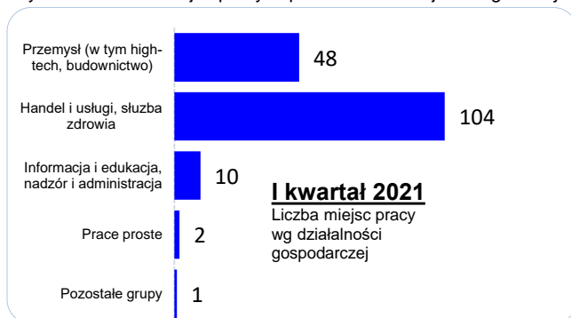
Wykres 2. Liczba miejsc pracy w próbie badawczej według rodzajów działalności

W bardzo ograniczonym zakresie poszukiwano pracowników w pozostałych grupach zawodów (przedstawiciele władz publicznych, fizycy i astronomowie, meteorolodzy, specjaliści nauk o ziemi, matematycy, statystycy i pokrewni oraz siły zbrojne). W przypadku pierwszej i ostatniej grupy zawodów (tj. „przedstawiciele władz publicznych” oraz „sił zbrojnych”) miejsce pracy ma źródło w wyborze lub jest oferowane na podstawie odrębnych zasad.